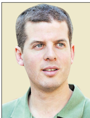
"מצור של דהיגטימציה. רוגן שובל

ועכשיו אנחנו מגיעים לעניינים היותר חשובים. התוצאה הישירה שאליה חותר ארגון "יש דין" מצוינת